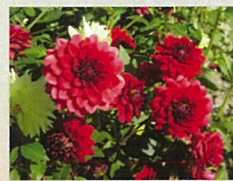
市花ダリアの切り花 (写真はイメージ)