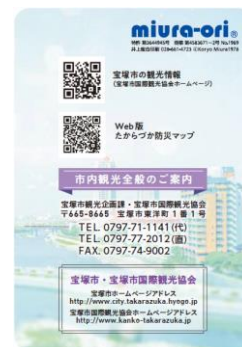
新しくなった観光ガイドマップ (イメージ)